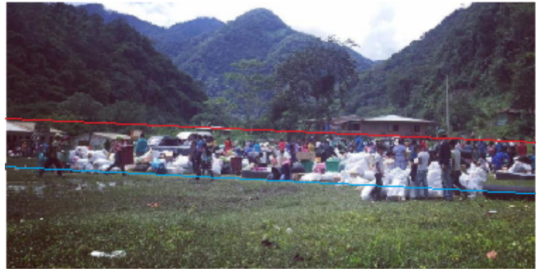
Ilustración 2. ‘Los embera-katío vuelven a su tierra ancestral’ (ElTiempo.com, 20 de mayo de 2017).

tratando de construir la imagen de los indígenas como personas inadecuadas. En la imagen 2, aparecen las víctimas retornando a su territorio ancestral: el plano general hace que se difumine el sentido de la víctima y se cree visualmente una densidad de la desorganización que se ve reforzada por la presencia de sacos de color blanco, que por lo indicado en la narrativa se puede inferir que son los implementos de aseo y las ayudas estatales.