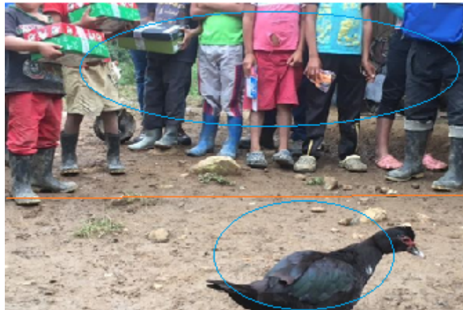
Ilustración 4. “Humanizar al enemigo, ¿acaso no es humano ya?” (ElTiempo.com, 30 de mayo de 2017).

inmediato; la gallina es un símbolo que en la cultura occidental y colombiana está asociado con la precariedad. Aunque se pueda establecer que hay un ejercicio ético al no mostrar los rostros, se produce un fenómeno de espectacularización que implica encuadrar la imagen de manera que se produce una hipérbole de la situación de los actores representados generando una amplificación de lo construido en el discurso escrito. La línea roja marca el límite entre lo que está en primer plano y lo que está en segundo y los círculos rojos muestran que no hay un foco único en la imagen.