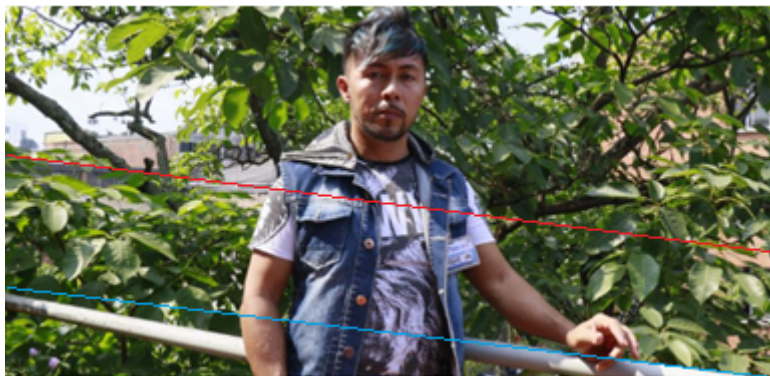
Ilustración 1. “LGTBI, las víctimas que ya no quieren ser invisibles” (ElTiempo.com, 31 de mayo de 2017).