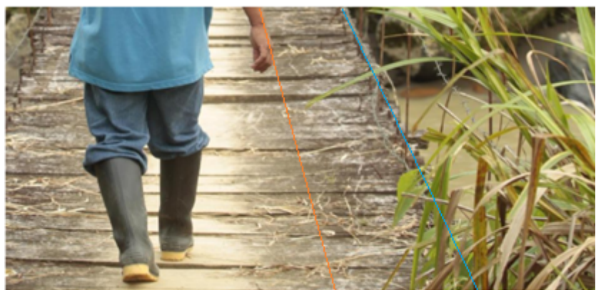
Ilustración 5. “Antes de ser guerrillero de las Farc fue víctima, ahora es líder” (ElTiempo.com, 31 de mayo de 2017).

Otra narrativa mediática que reproduce el mismo fenómeno de deshumanización es “Antes de ser guerrillero de las Farc fue víctima, ahora es líder” donde si bien el contenido de la narrativa es desarrollado por un excombatiente, lo que se propone es desestructurado por la selección del titular y la imagen que es realizada por el medio. Se construye un sentido negativo sobre la persona por su condición de excombatiente, con la diferencia de que en este caso se trata de matizar esto presentando las otras reflexividades del sujeto como víctima y como líder, y en el caso del antetitular como indígena. La imagen, sin embargo, despotealiza todas esas subjetividades.