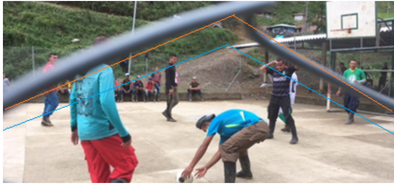
Ilustración 3. “Humanizar al enemigo, ¿acaso no es humano ya?” (ElTiempo.com, 30 de mayo de 2017).

En el plano más cercano se encuentra un elemento que icónicamente se asemeja a un fragmento de malla que funciona como límite del campo de fútbol, pero también un límite entre el fotógrafo y lo fotografiado. Debido al punto de vista de la foto, la malla constituye también una frontera con el espectador lo que crea dos procesos: la exclusión del otro como algo que se puede ver, pero con lo que no se debe interactuar –porque genera peligro–; y, se formula una distancia social suficiente para evitar crear el sentimiento de empatía, lo cual se refuerza con la frontalidad del plano que impide subjetivizar lo enfocado. Otro efecto es la despersonalización de uno de los individuos, ya que el fragmento de malla le cubre el rostro configurando un anonimato, además de la despotencialización de la identidad del sujeto. Ese efecto está dado por la malla que funciona como un punto de fuga a través del cual se construyen los vectores de la imagen, creando líneas paralelas –ver línea roja y azul– con el camino de tierra que se observa en la montaña y que atraviesa la humanidad de los personajes representados.