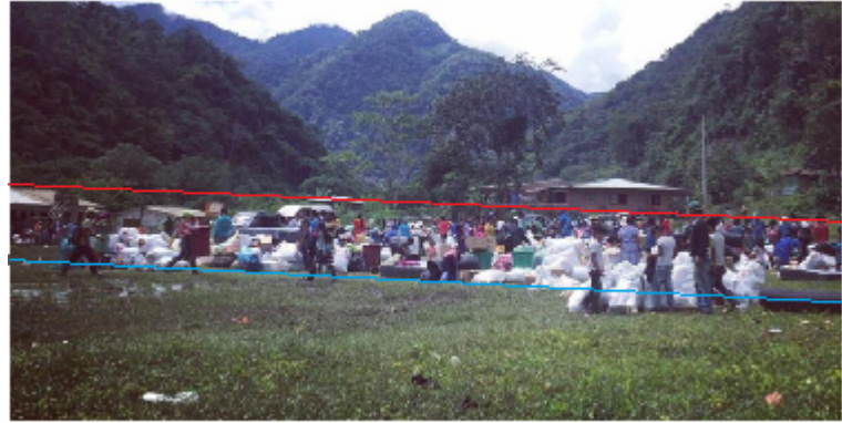
Ilustración 2. ‘Los embera-katío vuelven a su tierra ancestral’ (ElTiempo.com, 20 de mayo de 2017).

tratando de construir la imagen de los indígenas como personas inadecuadas. En la imagen 2, aparecen las víctimas retornando a su territorio ancestral: el plano general hace que se difumine el sentido de la víctima y se cree visualmente una densidad de la desorganización que se ve reforzada por la presencia de sacos de color blanco, que por lo indicado en la narrativa se puede inferir que son los implementos de aseo y las ayudas estatales.