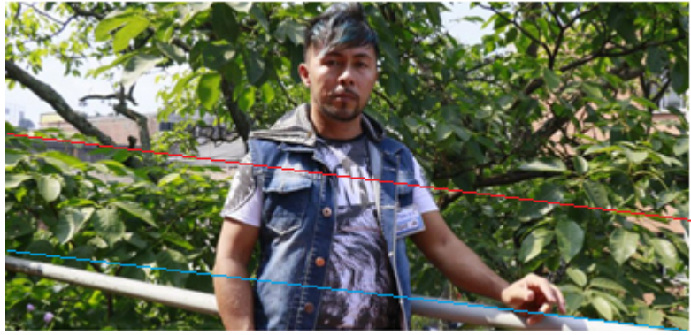
Ilustración 1. “LGTBI, las víctimas que ya no quieren ser invisibles” (ElTiempo.com, 31 de mayo de 2017).