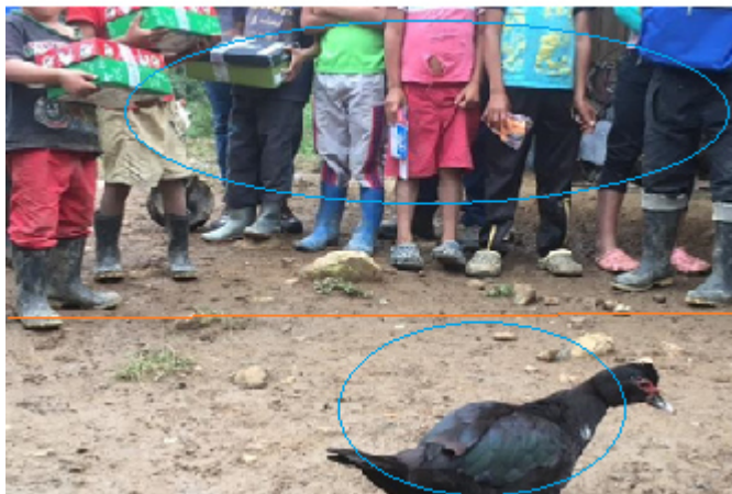
Ilustración 4. “Humanizar al enemigo, ¿acaso no es humano ya?” (ElTiempo.com, 30 de mayo de 2017).

inmediato; la gallina es un símbolo que en la cultura occidental y colombiana está asociado con la precariedad. Aunque se pueda establecer que hay un ejercicio ético al no mostrar los rostros, se produce un fenómeno de espectacularización que implica encuadrar la imagen de manera que se produce una hipérbole de la situación de los actores representados generando una amplificación de lo construido en el discurso escrito. La línea roja marca el límite entre lo que está en primer plano y lo que está en segundo y los círculos rojos muestran que no hay un foco único en la imagen.